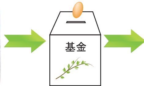
林業活性化基金(仮称)