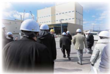
多気バイオパワー(見学会)

この考えを基に、多気バイオパワーのご見学については、これまでの内容を見直し、ご見学の皆様に林業支援へのご理解を頂き、見学会において、地域、林業支援への協力金(1,000円/人※学生は除く)をご負担いただき、多気町様を通じて、三重県を中心とする林業の活性化に役立てさせていただくものであります。